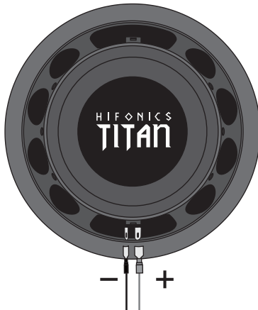
ANSCHLÜSSE FÜR DEN VERSTÄRKER LINKER KANAL